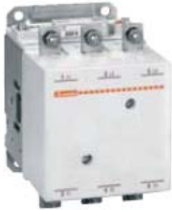
11B115 - 11B630